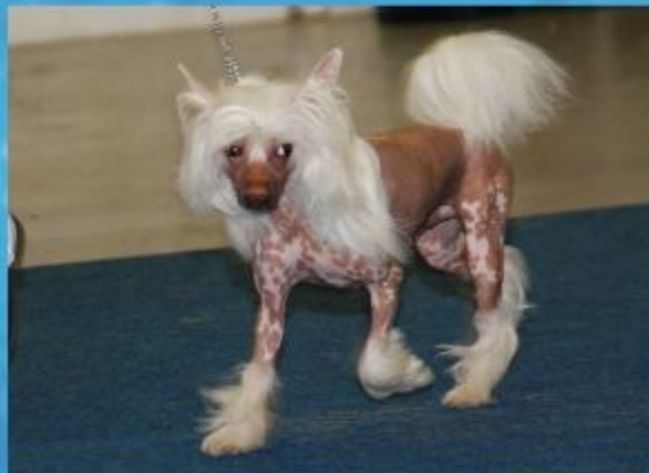
Wo steht Herrchen mit dem Foto?