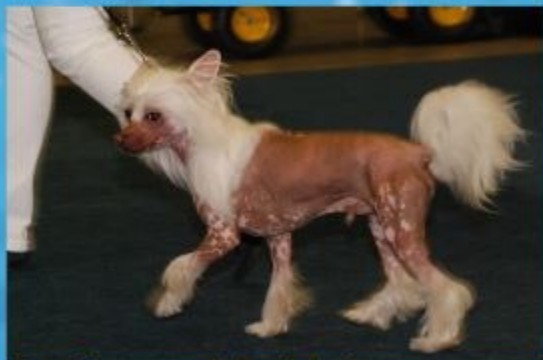
Im Ring war ich richtig gut