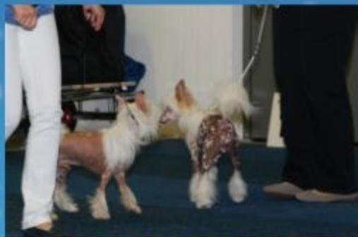
Vor dem Start noch schnell die Konkurrenz beschnuppern