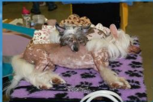
Langes Warten auf den Start

Am 6.9.14 gab es in Gießen das erste V1 und die erste Anwartschaft auf den Titel